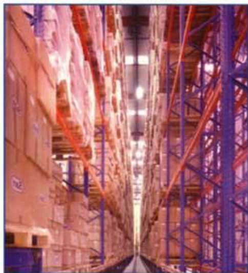
Διαδοκίδοσεις για την μεγαλύτερη στατικότητα της κατασκευής